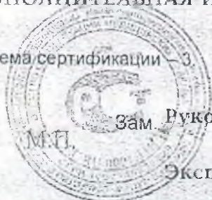
Схема сертификации — 3